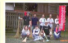
穂觸(くしふる)神社の清掃活動

★熊本県信用組合協会主催のもと当組合本店営業部にて「いきいき献血運動」を実施し、多くの皆様にご協力いただきました。