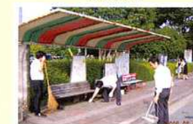
市役所周辺道路清掃活動

★当組合各営業店ごとに清掃活動等を実施いたしました。 【宇土支店】 【高千穂支店】